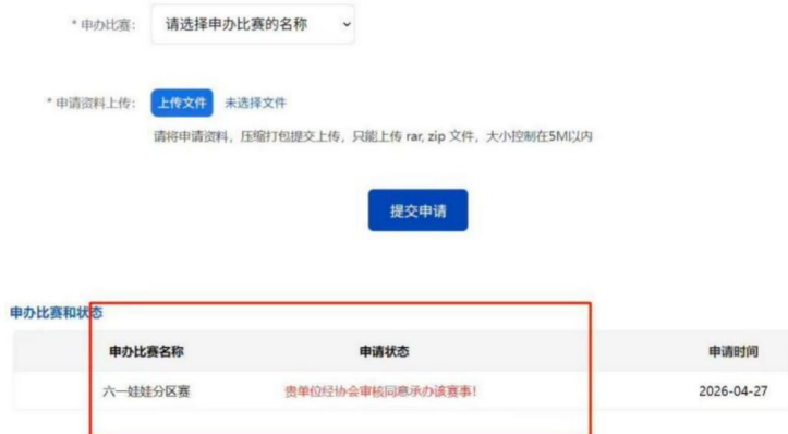
申请状态查看是否通过