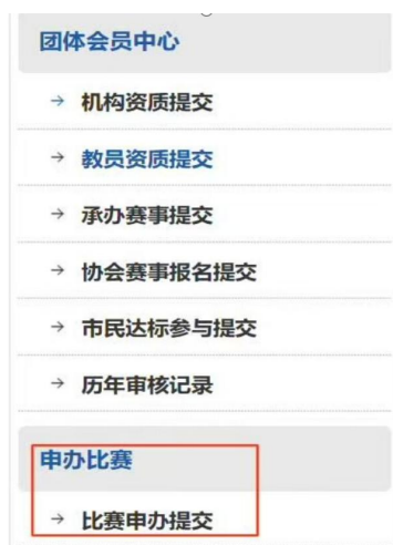
选择比赛申办提交