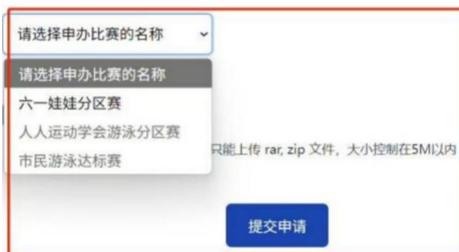
找到比赛名称并提交申请材料